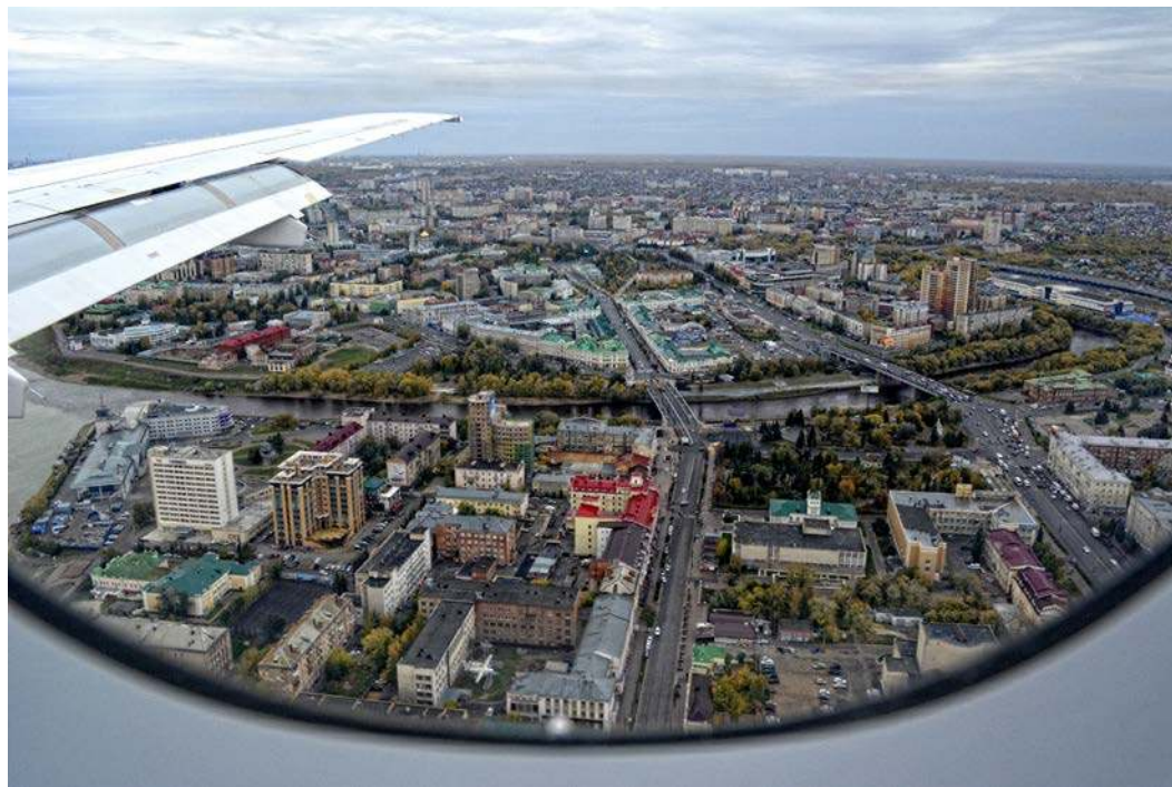
Вид на центр города Омска с борта пролетающего над ним пассажирского самолёта

Иду по Омску, а в мозгу звучат строки Анны Шаркуновой: «Влюбляются в тончайшие натуры \ И трещинки на розовых губах». И таких мелочей, «трещинок на розовых губах» у Омска множество. Историй порой негромких, но неподдельно искренних и оттого ошеломляющих.