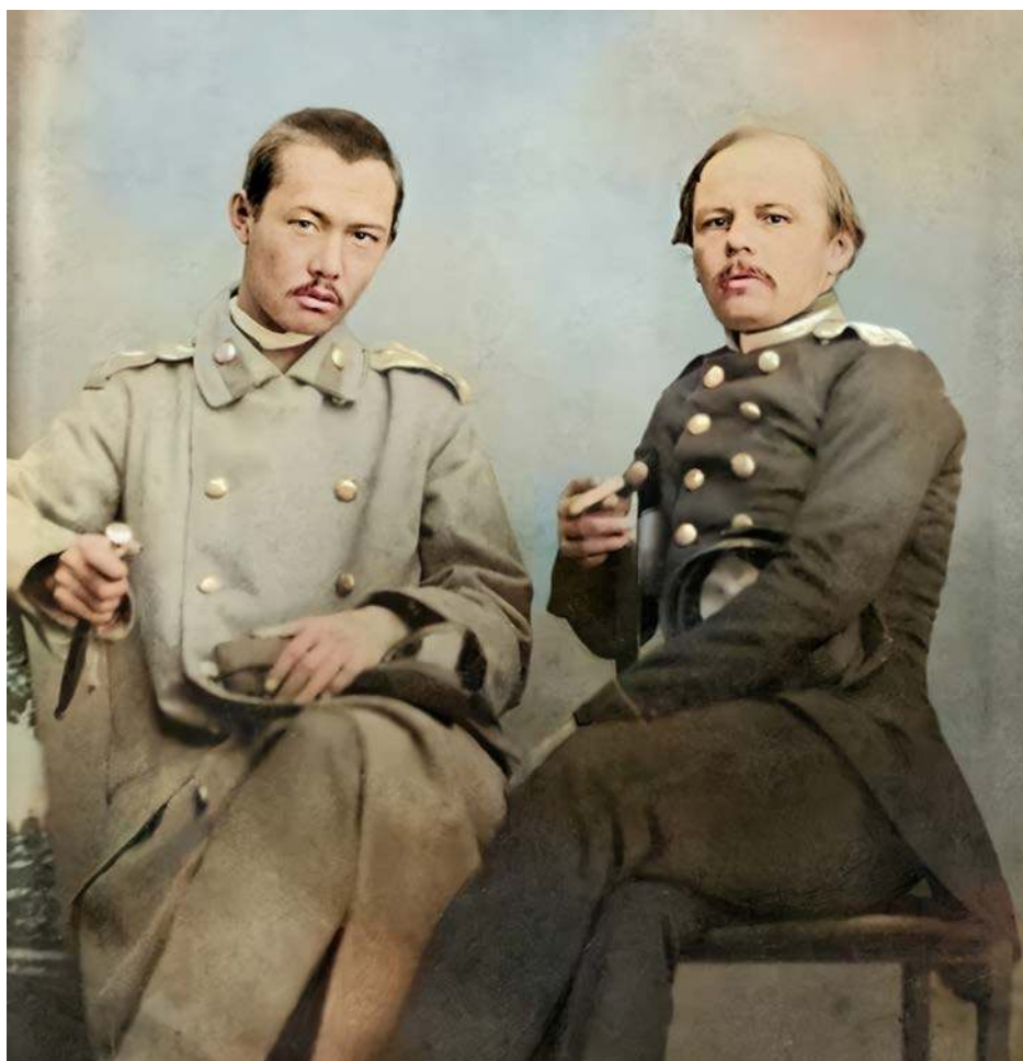
Фёдор Достоевский и Чокан Валиханов

С 1789 года в этих стенах действовала специальная школа для изучения «туземных и восточных» языков, получившая название Азиатского училища. Та самая «школа толмачей», как её называют порой горожане, та самая «омская разведшкола». Нелепое название, конечно – «разведшкола», но лишь на первый взгляд. Азиатское училище занималось подготовкой переводчиков для общения с азиатскими народами. Чиновники-мусульмане и казаки, служившие в пограничных гарнизонах, отправляли в школу своих детей, которых обучали татарскому, монгольскому и маньчжурскому языкам. Юным ученикам предстояло защищать словом и делом интересы своего Отечества на Востоке, дипломатией и умелыми торговыми договорённостями склоняя соседей России на нашу сторону, предупреждая возможные конфликты, добывая важные для государства сведения.