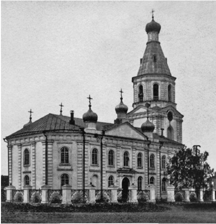
Воскресенский военный собор

Весь он – напоминание о суровых армейских нравах и строгости. Если на фотографии закрыть ладонью верхнюю часть храма с куполами и показать снимок иногороднему человеку, тот может и не признать в каменном здании храм – внешний облик собора строг. Никаких сантиментов, никаких излишеств. Здесь, на одном из ключевых рубежей государства, иначе и быть не могло.